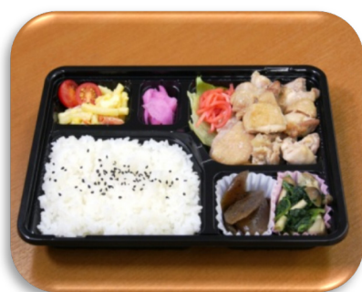
ご高齢者向け健康管理食